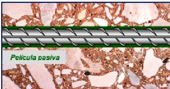
Fig.1: Película pasiva en la armadura de acero.

Esta película se rompe a causa del ingreso de sustancias agresivas por un mal recubrimiento. Por tanto, la corrosión de las armaduras se desencadena con una triple consecuencia: