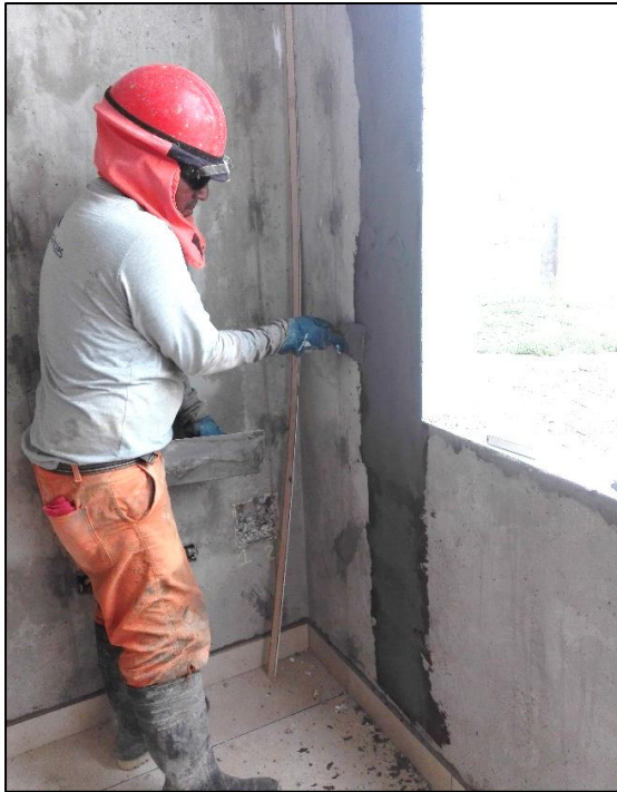
Fig.6: Aplicación de la primera capa del mortero impermeabilizante para otorgar una mayor protección.

La preparación se debe realizar según la hoja técnica. En esta experiencia, el mortero impermeabilizante era bicomponente, donde 1 saco de la parte A rendía para 1 garrafa de la parte B.