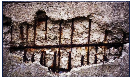
Fig.2: Armadura en proceso de corrosión.